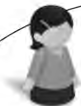
主任ケアマネジャー

虐待や悪質な訪問販売等の消費者被害の防止をしたり、認知症などで判断能力が低下し、金銭管理や日常生活上の契約などに不安がある方への成年後見制度などの活用を支援します。