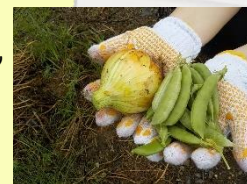
収穫した野菜たち