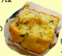
美味しい手作りケーキ ごちそうさまでした!