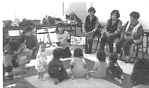
⑦高齢者と子育てサロンの交流会