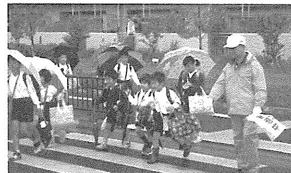
①登下校時の安全見守り活動