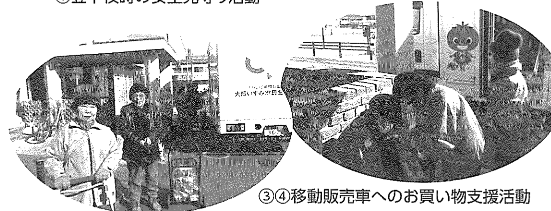
③④移動販売車へのお買い物支援活動