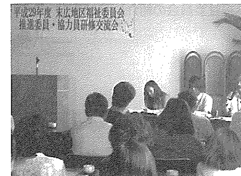
②推進委員・協力員研修交流会