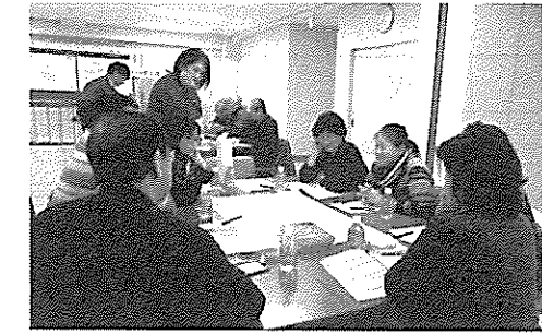
地域の暮らしを話す会