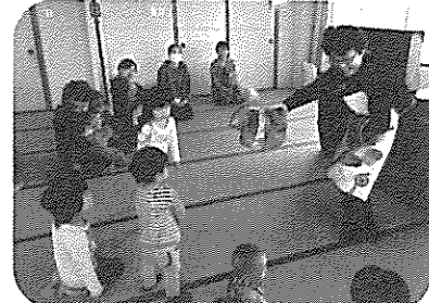
エプロンシアター