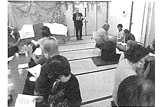
クリスマス交流会