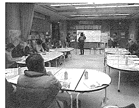
地域の暮らしを話す会