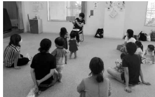
保育士の先生による 絵本の読み聞かせ♪

中町子育て広場では、子どもたちが思い思いのおもちゃで自由に遊んだり、保育士の先生と一緒に歌を歌ったり、工作をしたりして楽しい時間を過ごします。保護者の方同士での交流もしながら楽しく遊んでいます。ぜひご参加ください♪