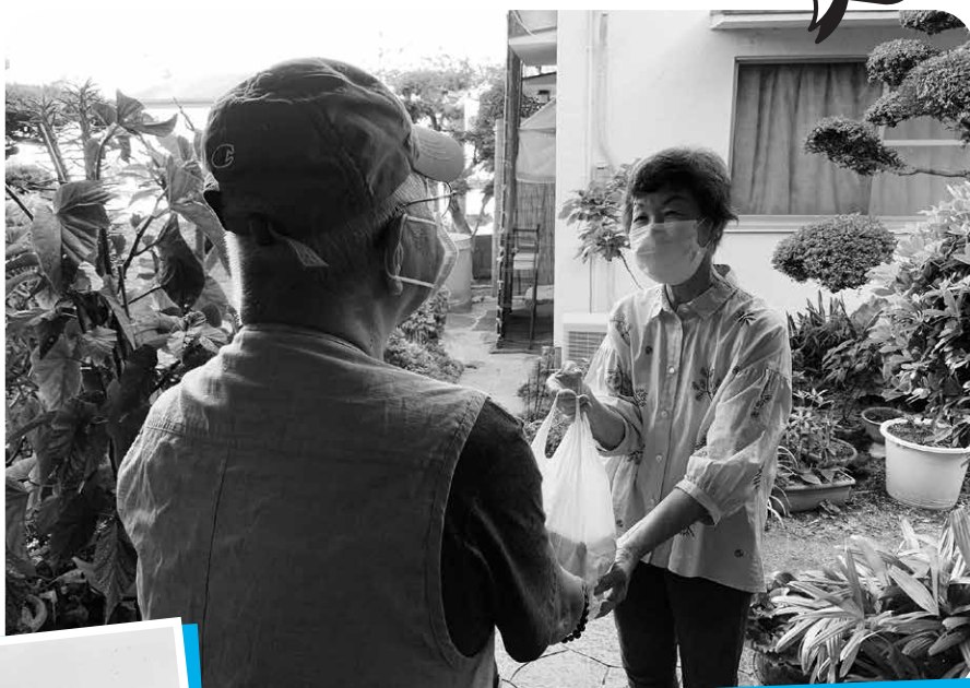
プレゼント配りの様子

長坂地区の新家町支部福祉委員会では「敬老の日」にあわせ、一人暮らし高齢者など地域での見守りが必要な方にプレゼントを贈りました♪ プレゼントと一緒に素敵なメッセージと防災についてのチラシを添えて、いつまでも元気で活気のある地域を願い、福祉活動に取り組んでいます。