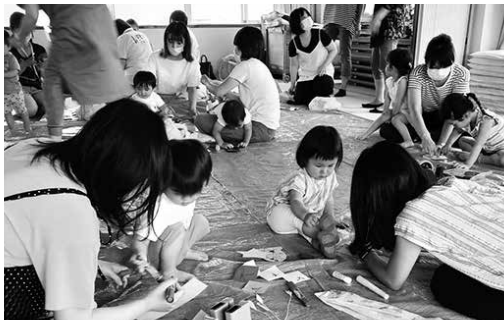
みんなと一緒に 七夕かざりを作りました♪

今年で小ざくら広場は10年が経ち、これまでたくさんの子どもが参加されました。七夕やクリスマスなど季節の行事や保護者も楽しめる茶道体験の催し、保健センターの健康指導といった育児の情報提供も企画しています。ぜひ、一度覗いてください。