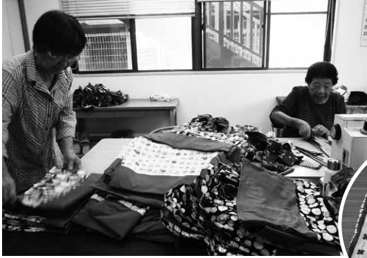
株式会社 永橋染工場さんから布のご寄付をいただきました。

洋裁の技術を持つボランティアが介護を必要とする人のための衣服のリフォームに取り組んでいます。毎年社協ふれあいクリスマス会のプレゼントを作ってくれています。