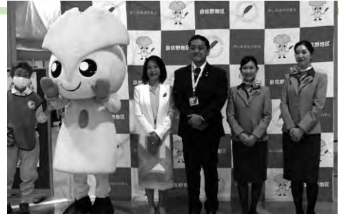
オープニングイベントとして、関西国際空港内で「赤い羽根 空の第一便」のセレモニーを開催しました

元町町会 (25,000)・下瓦屋町会 (10,000)・下瓦屋南町会 (16,000)・中村町会 (22,500)・春日町町内会 (23,000)・新町町内会 (38,000)・野出町町内会 (20,000)・鶴原町町会 (100,000)・東佐野台町会 (15,000)・本町町会 (20,000)・松風台自治会 (26,100)・松原団地住宅自治会 (20,100)・新安松町会 (30,000)・高松東町会 (30,435)・高松東町会第1班有志 (309)・樫井東町内会 (14,000)・羽倉崎町内会 (50,000)・高松北町会 (38,000)・土丸町会 (12,500)・下村町会 (12,000)・栄町町内会 (7,000)・貝田町内会 (20,000)・新長滝自治会 (16,800)・見出住宅自治会 (15,277)・母山町会 (7,700)・旭町町会 (34,000)・機場町会 (6,000)・西本町町会 (25,000)・上村町会 (10,000)・上町町会 (72,000)・府住東羽倉崎自治会 (30,000)・高松町会 (10,000)・日根野西町会 (6,000)・大宮町町会 (25,920)・高松南町会 (10,000)・東上町内会 (15,500)・久ノ木町内会 (3,550)・中筋町内会 (3,750)・西出町内会 (5,650)・野口町内会 (4,500)・西上町内会 (17,800)・新道出町内会 (14,750)・野々地蔵町内会 (9,500)・俵屋町内会 (3,000)・上瓦屋町内会 (60,000)・羽倉崎上町町内会 (20,000)・鶴原東町会 (50,000)・東羽倉崎町町会 (19,700)・湊町内会 (67,500)・安松町会 (60,000)・泉陽ヶ丘自治会 (21,000)・女形町会 (6,700)・岡本町会 (40,000)・ふぁみーゆ泉佐野 (10,000)・郷田町内会 (3,300)・新泉ヶ丘自治会 (15,641)・葵町町内会 (60,000)・佐野台町会 (30,000)・上大木・中大木・下大木町会 (20,300)・西佐野台町会 (19,800)・長滝住宅自治会 (10,000)・新家町内会 (55,000)・鶴原中央住宅自治会 (35,000)・笠松町内会 (100,000)・笠松町7区17組有志 (7,935)・市場町町会 (17,515)・泉ヶ丘町内会 (64,512)・中町町内会 (25,360)・幸町町会 (13,900)・松原町町会 (34,700)・長滝第一住宅自治会 (14,500)・長滝連合町内会 (32,000)・樫井西町会 (51,000)・中庄町内会 (103,800)・鶴原北住宅自治会 (17,000)・大西町内会 (30,000)・南泉ヶ丘町会 (28,000)・若宮町会 (11,000)・匿名 (1,000)