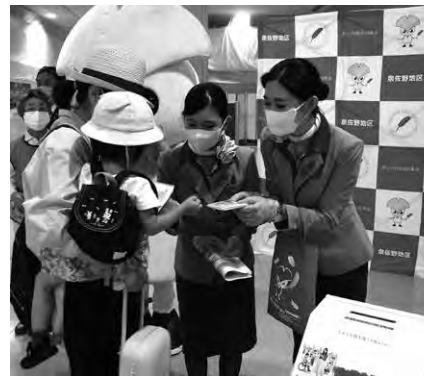
空港内で街頭募金も実施しました