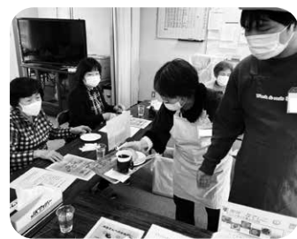
花筏のスタッフさんと一緒にパンとコーヒーをお出します