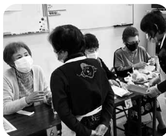
カフェでおしゃべり

感染症対策をしながら、現在活動している地域のサロンの一部をご紹介します。(11月時点)