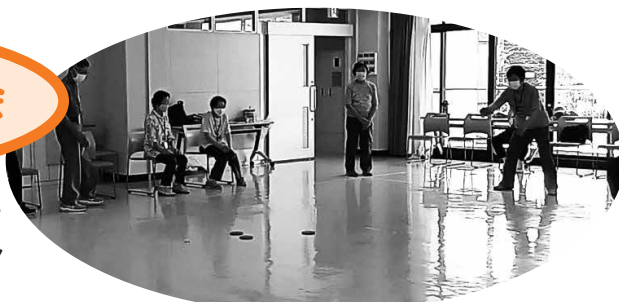
※ディスコン…チームに分かれて円盤を投げ、目標に近い競争スポーツ。

健康寿命を延ばすために、明るく楽しく交流するきっかけとしてディスコン※を地域に広げることが目標に活動しています。見学・参加体験が可能です。 興味のある方はボランティアセンターまでお問い合わせください。 ☎072-464-2259 FAX462-5400