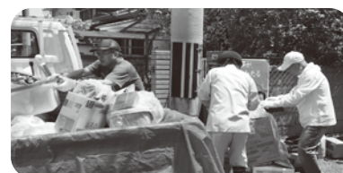
粗大ごみ回収の様子

日根野西支部では、自力で粗大ごみをだすのが困難なひとり暮らしの要援護高齢者を対象に、粗大ごみの回収活動を行っています。