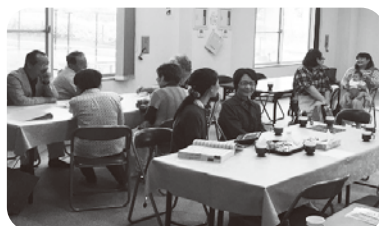
中町カフェの様子

中央地区福祉委員会・中町支部では、平成29年5月より、それまで毎月第1・第3水曜日に行っていた子育てサロンのうち、第3水曜日を「なかまちカフェ」として子育て世代の人以外も参加できる形で行っています。