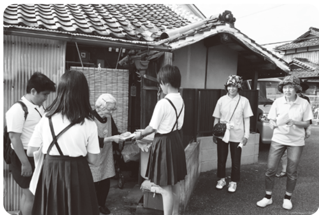
日新地区福祉委員会・友愛訪問活動