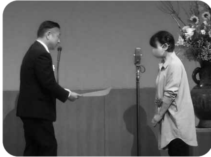
《団体》長坂地区福祉委員会