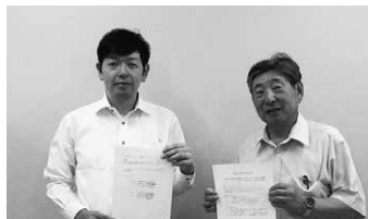
泉佐野市青年団協議会(令和5年7月)