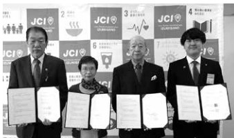
泉佐野青年会議所(令和4年10月)

日頃からの顔の見える関係づくりとして、令和5年度には、災害ボランティアセンター設置模擬訓練にもご参加いただきました。