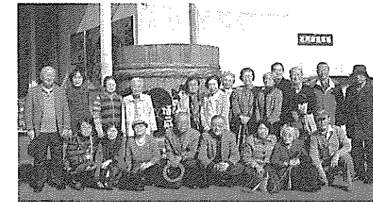
いきいきサロン小旅行