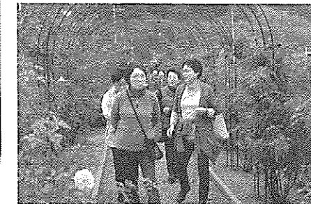
食事会・イングリッシュガーデン