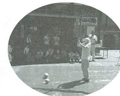
親子ふれあい木工交流会