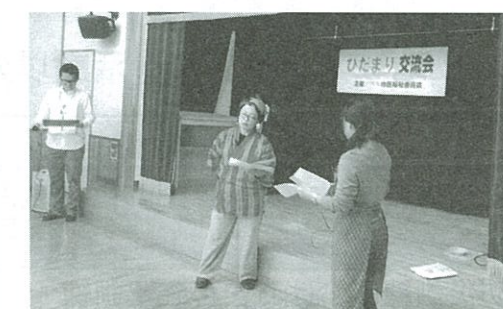
認知症予防の寸劇