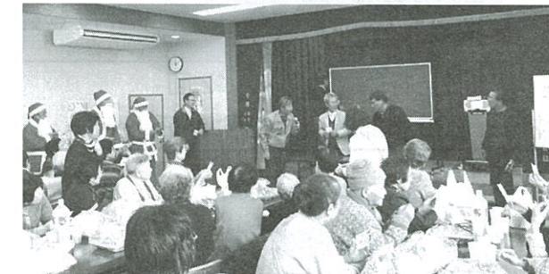
新長滝 カフェと青空市場