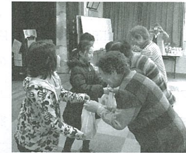
子育てサロンあおぞら