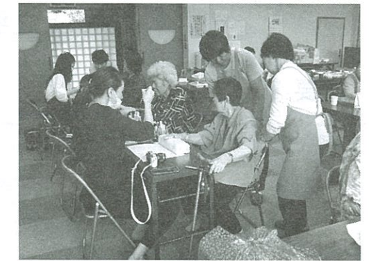
ふれあいサロン かけはし ネイル