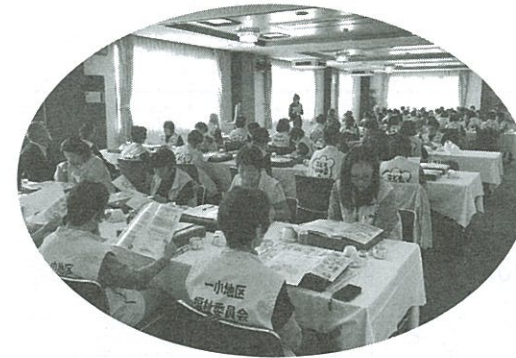
一小地区研修交流会