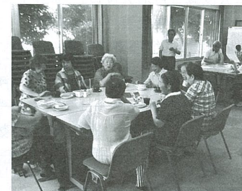
西本町支部 西本町カフェ