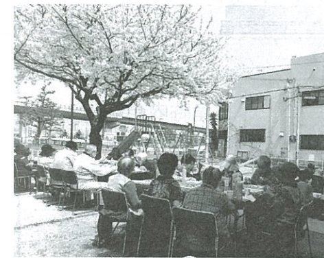
本町支部 お花見交流会