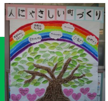
人にやさしい町づくり作成ワーク “オークの木”