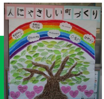
人にやさしい町づくり作成ワーク “オークの木”