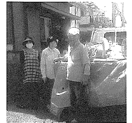
汗だくの粗大ゴミ回収