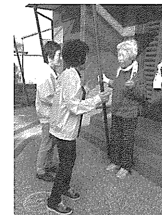
防災訓練(安否確認訪問)