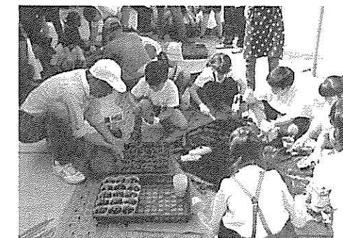
みんなで育てる 花いっぱいプロジェクト