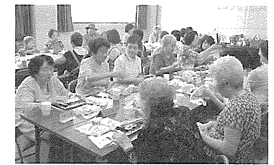
ふれあいサロンかけはし 食事会