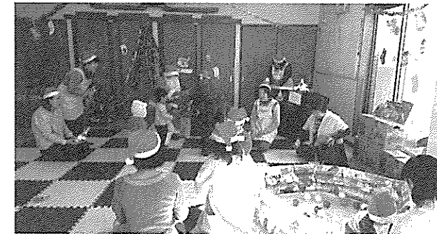
子育てサロンあおぞら クリスマス会