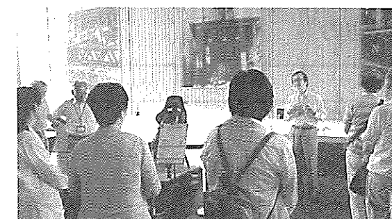
推進委員・協力員 合同研修会