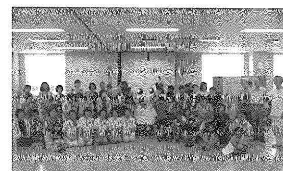
ひだまり参加者全員の記念撮影