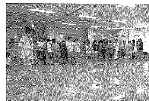
ひだまりディスコン風景