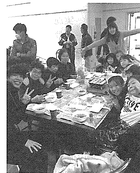
寺子屋交流会 たこ焼パーティー