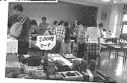
土丸福祉委員会 バザー