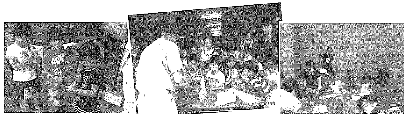
親子ふれあい木工交流会