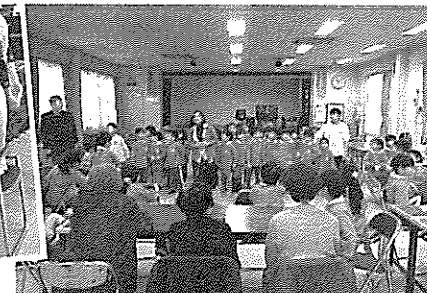
クリスマスカード作成後 なかよし保育園児の合唱