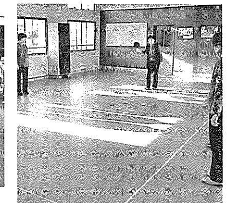
ディスコンゲーム