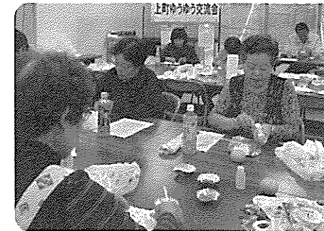
上町ゆうゆう交流会