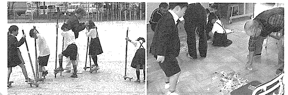
日根野小学校との 世代間交流会