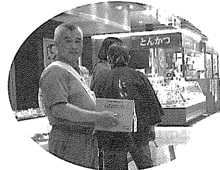
イオンモール日根野 幸せの黄色いレシートキャンペーン