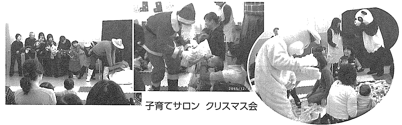
子育てサロン クリスマス会